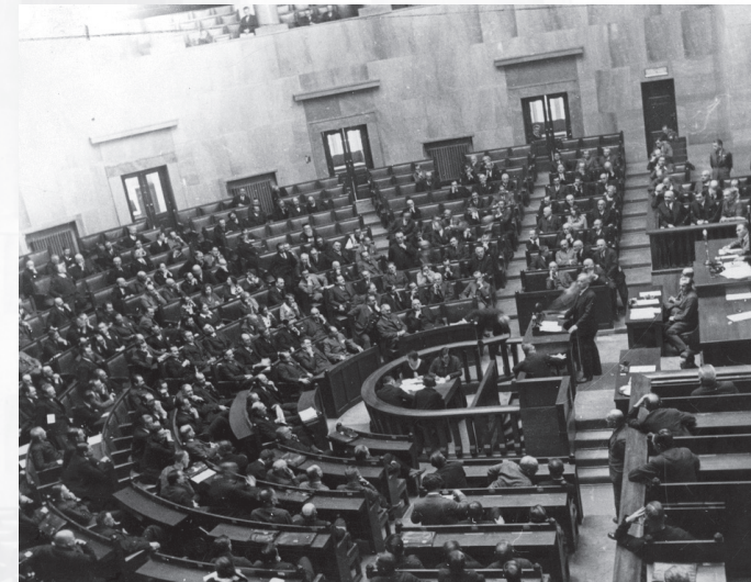
▲ PRZEMÓWIENIE ROMANA RYBARSKIEGO W SALI SEJMOWEJ 4