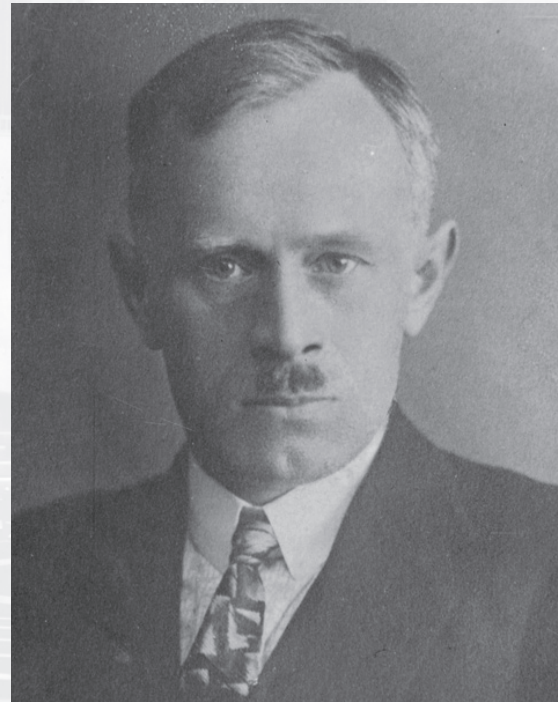
▲ Portret Romana Rybarskiego 1